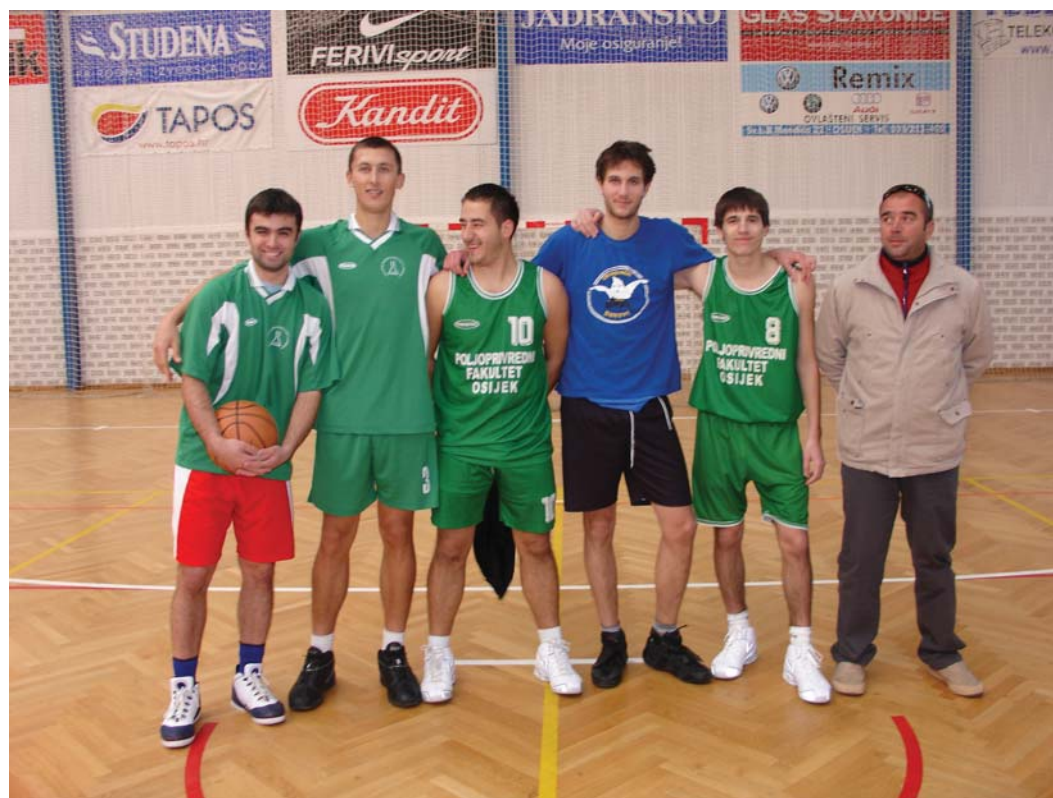
Muška košarkaška ekipa "Poljos" na Sveučilišnom prvenstvu