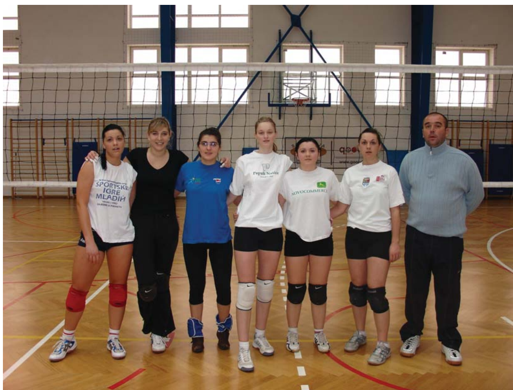
Ženska odbojkaška ekipa "Poljos" na Sveučilišnom prvenstvu