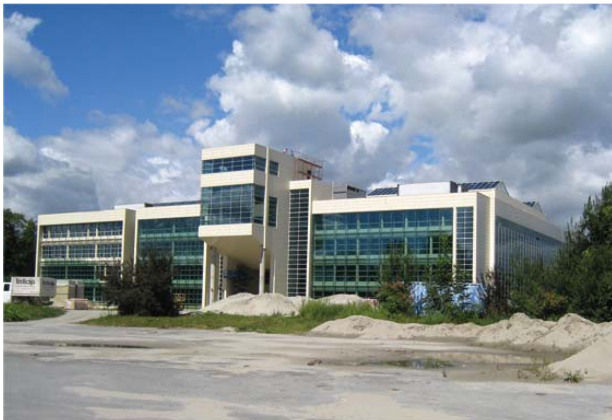
... a ova prelijepa zgrada u skoroj će budućnosti biti svjedokom daljnjih znanstvenih, nastavnih, studentskih i drugih aktivnosti Poljoprivrednoga fakulteta u Osijeku