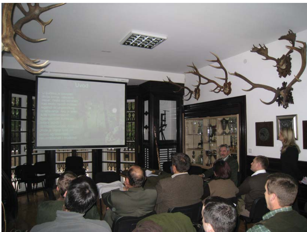
Studenti prezentiraju seminarske radove iz modula Lovstvo i kinologija u Lovачkom muzeju Hrvatskog lovačkog saveza u Zagrebu (prosinac 2009. godine)